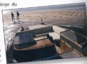
L'architecte a opté pour un couloir central qui coupe le pare-brise en deux. Finis les déplacements hasardeux sur les passavants !