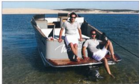
Embase relevée, le tirant d'eau se réduit à 45 cm. Et la plate-forme de baign arrière est bien utile pour débarquer sur la plage.

tage et au bain de soleil arrière. Bravo également pour le frigo et la plancha. C'est vraiment sympa de pouvoir rassasier ses invités à l'heure du dîner. Une nuit à bord ? C'est possible. L'architecte a en effet prévu une petite cabine cosy idéale pour deux. Dommage que la finition ne suive pas les qualités de la carène et de la motorisation. Les vaigrages et les assemblages des boiseries sont en effet approximatifs. Vu le prix demandé, l'acheteur est en droit d'exiger des matériaux irréprochables et proprement montés. S'il a effectué ses premiers bords sur le Bassin d'Arcachon, l'Ecla 29 ne dépassera pas à Monaco ou dans la lagune de Venise. Le premier distributeur intéressé par la diffusion de ce runabout semi custom est d'ailleurs basé sur la Côte d'Azur. Pas vraiment un hasard.